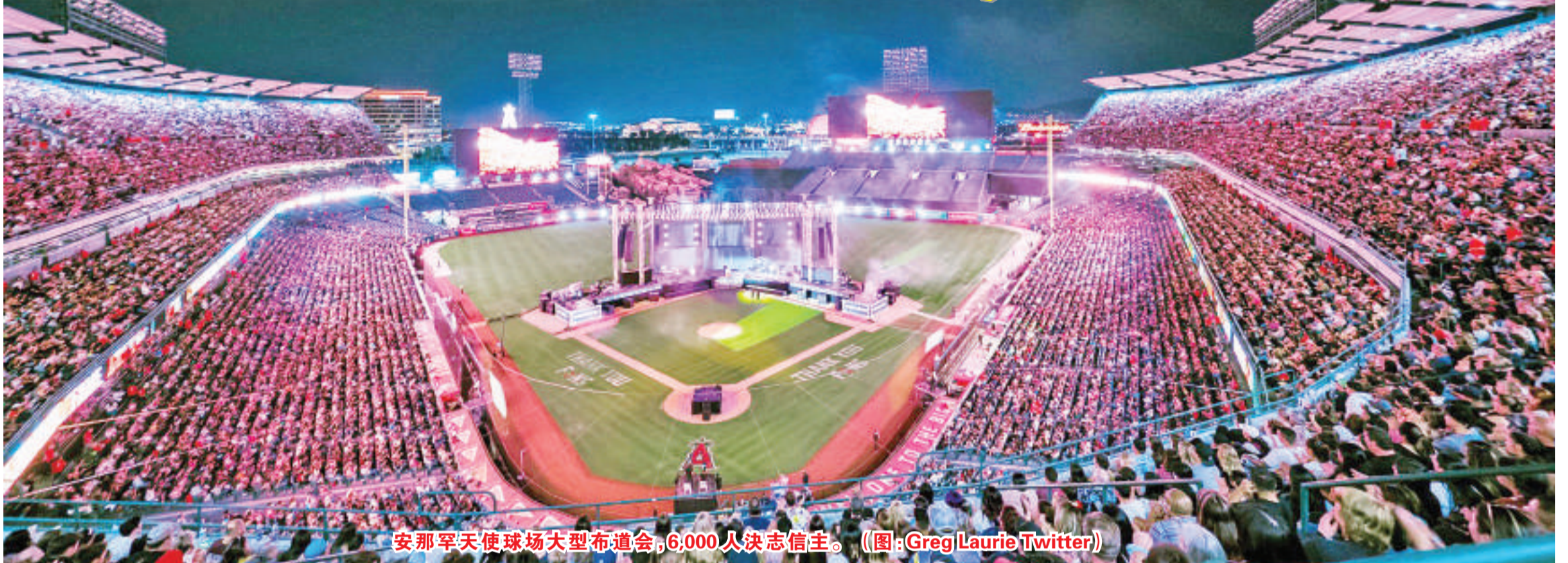
安那罕天使球场大型布道会,6,000人决志信主。

美国南加州有基督教组织举行大型布道会,福音大丰收,4万人在体育场内、20万人在世界各地在线观看,6,000人将生命献给基督。